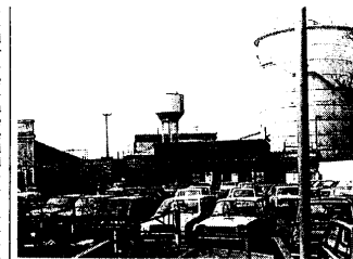
La Breda fucine di Sesto San Giovanni

SESTO SAN GIOVANNI - Gli uffici della «Breda» sono stati occupati ieri dai lavoratori per protestare contro il rischio della liquidazione coatta della società (attualmente è in attività la «Nuova Breda Fucine») e il pericolo che a fine mese non vengano pagati gli stipendi ai 60 dipendenti ancora in servizio e le indennità ai sessanta cassintegrati.