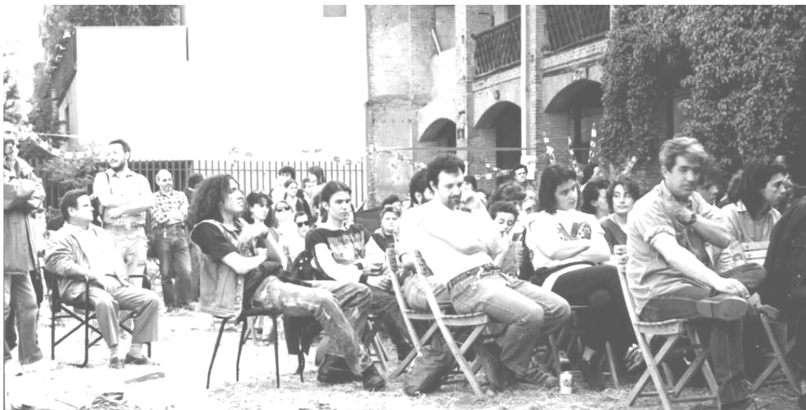
Festa del 1° maggio a Cascina Novella.

A maggior ragione abbiamo fin da subito sostenuto la battaglia degli ex-operai della Breda e di altre fabbriche ammalati di cancro a causa della nocività in fabbrica, ospitando il "Comitato per la difesa della salute nei luoghi di lavoro e nel territorio" e appoggiandoli nelle loro lotte; cosa che continueremo a fare nella nuova sede di via Magenta, nella quale questi operai continueranno a riunirsi.