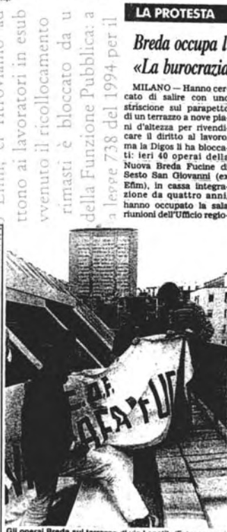
Gli operai Breda sul terrazzo di via Lepetit

Nei giochi convocati Fucine situazione paradossale che vogliamo evidenziare a governo, Efm, ci ritroviamo ad tonno ai lavoratori in esub venuto il ricollocamento rimasti è bloccato da u della Funzione Pubblica: a la legge 738 del 1994 per il