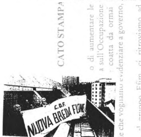
Operai Breda: occupazione di protesta