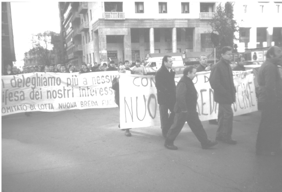
Durante una manifestazione sindacale: pochi lavoratori attorno alla striscione del consiglio di fabbrica; molti dietro quello del comitato.